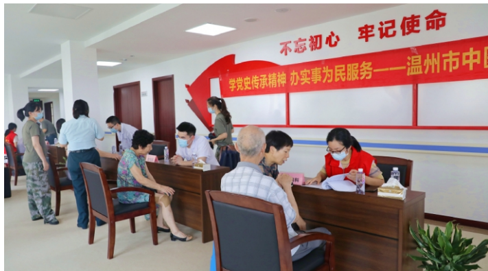
等中医适宜技术。中医师也为老人们准备了花茶,并围绕老年常见综合征以及中医养生等话题为老人们开展药食同源健康知

在活动现场,各科专家组成的医疗护理团队认真为每一位老人进行中医药医疗服务,不仅针对不同病症和个体差异提出合理的诊疗建议和治疗方案,还带去了夏季最热门的养生项目冬病夏治“三伏贴”和耳穴贴压